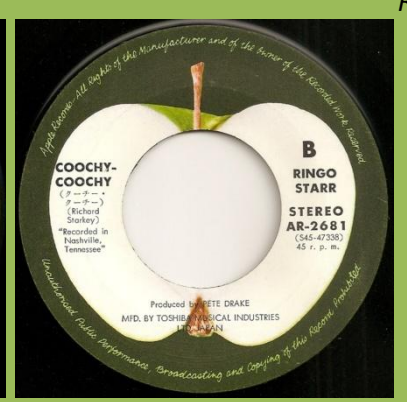
Red vinyl edition