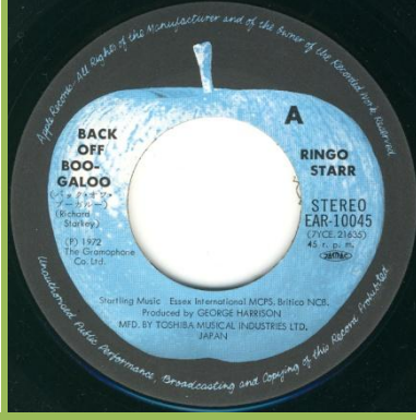
Black vinyl edition

Come on blues what you gome do now Come on blues what you gome do now Back off boogaloo I said back off boogaloo I said back off boogaloo