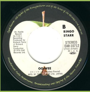
Promo with corrected labels