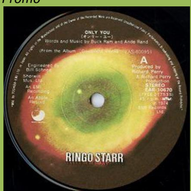
Double pressing ring