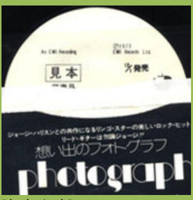
Black vinyl Promo